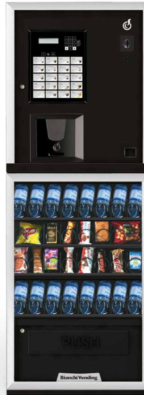
LEI300 SMART + ARIA S SLAVE